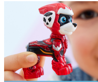
UNIEK MARSHALL FIGUUR

PAW Patrol , Camion dei Pompieri di Marshall Tematizzato : Il Super Film, con Luci e Suoni, Giochi per Bambini e Bambine, 3+ anni. Tipo di prodotto: Camion dei pompieri, Tema: PAW Patrol, Età consigliata (min): 3 anno/i. Tipo batteria: LR44, Numero di batterie: 3. Materiali: Plastica, Colore del prodotto: Rosso, Giallo