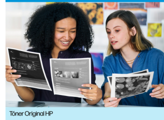
T ner Original HP

Impresiones de m xima calidad de las que puedes sentirte orgulloso